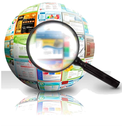
IMAGEN: competencias de informacion - Google Search