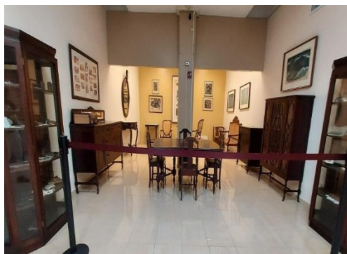
SALA DE ESTUDIOS HISTÓRICOS ISABEL GUTIÉRREZ DE ARROYO