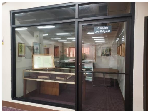
SALA DE ARTE RELIGIOSO